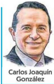
Carlos Joaquín González

ESTÁ DECIDIDO QUE en el primer trimestre del 2020 quede listo el proyecto ejecutivo del Tren Maya . El periodo para hacer cambios al trazo prácticamente se reduce a este mes de diciembre. El estado de Quintana Roo que gobierna Carlos Joaquín González es de los más adelantados. Le informo que recién se acaba de determinar que no habrá una estación en el centro de Cancún. El equipo del Fonatur que dirige Rogelio Jiménez Pons concluyó, con base en análisis financieros, urbanos, ambientales y de demanda, no es factible hacer el tendido de una red de 15 kilómetros del actual aeropuerto al municipio Benito Juárez, cabecera de Cancún.