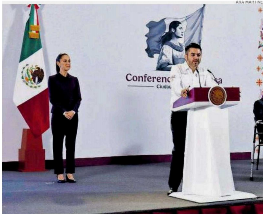
El director de Conagua durante la presentación del Plan Nacional Hídrico

EL GOBIERNO invertirá 20 mil mdp el próximo año para proyectos en este sector; mientras el sector privado inyectará 16 mil 400 mdp