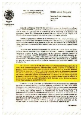
El expresidente Andrés Manuel López Obrador aún recibe seguridad de la Sedena en su quinta en Chiapas.

El Estado Mayor Conjunto de la Defensa Nacional señaló que es de "vital importancia" guardar la mayor discreción en los detalles, funciones y tareas que se llevan a cabo para la seguridad del expresidente Andrés Manuel López Obrador.