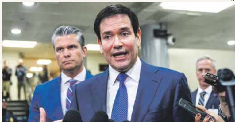
En el Congreso. Rubio dijo que EU se encargará de vender el crudo venezolano.