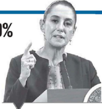
CLAUDIA SHEINBAUM Presidenta de México

“Es el número más bajo desde 2016. Es resultado de una estrategia de seguridad que va dando resultados”