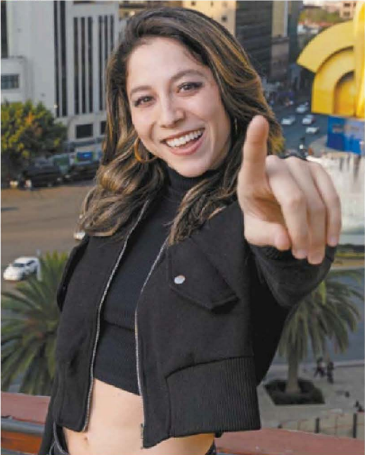
HUGO SALVADOR, EL UNIVERSAL