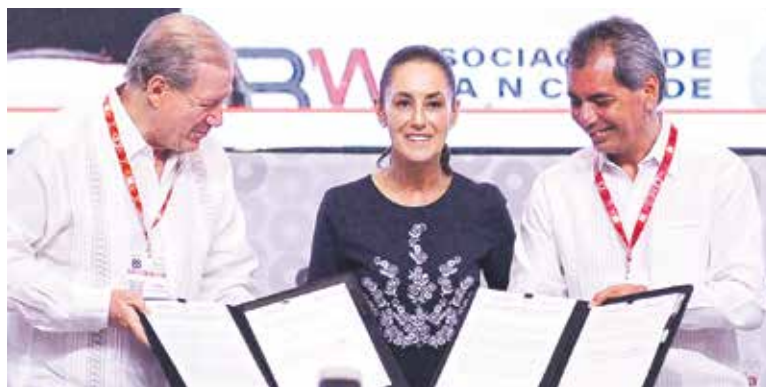
Convenio. Pactan banca y gobierno elevar en 3.5% anual financiamiento a Pymes.

La presidenta Claudia Sheinbaum se dijo optimista de que México pueda avanzar hacia una prosperidad compartida con la de EU, ante la buena relación que ha logrado su gobierno. En la inauguración de la 88 Convención Bancaria, dijo sentirse orgullosa de que no sólo hay una buena relación con EU, sino entre funcionarios. Destacó que la banca ha logrado una alta rentabilidad, aunque persiste el problema del limitado acceso al crédito. —F. Gazzón/A. Martínez/J. Leyva/PÁGS. 4Y5